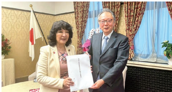
左から片山財務大臣、池田筆頭副会長