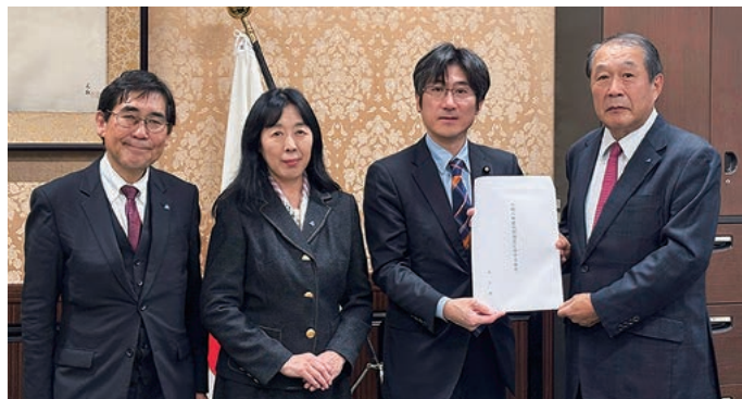
左から田中専務理事、丸山税制副委員長、舞立財務副大臣、飯野税制委員長