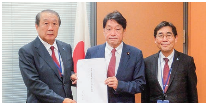
左から飯野税制委員長、小野寺税制調査会長、田中専務理事