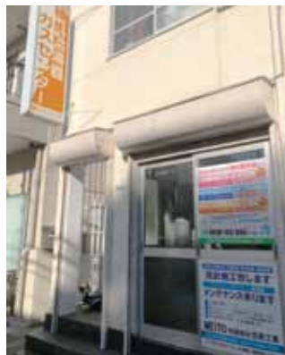
給湯器の工事はお任せください

器ガスセンター」を開業し、事務所も練馬区関町に移転しました。「練馬給湯器ガスセンター」は地域密着の住居設備機器(主に給湯器、エアコン、トイレキッチン浴室廻り等)のメンテナンス工事を承っております。同じような業者様は都内でも何百社もあります。弊社は都内でも一番の安い価格設定になつてると自負しております。その理由は明白で下請けには一切まわさず全て自社の職人が施工を行っている為、余計な経費がかかっておりません。 そして、他社様との大きな違いはガス器具のみとか、エアコンのみとか、水道関係のみとか、それぞれ分けられているわけではなく、設備業に関するものは全て対応出来る職人が揃っていることです。 例えば給湯器交換の場合、給湯器だけしか出来ないわけではございません。 給湯器の先には配管があり、その配管の先には水栓が付いております。それら全てを網羅しているため、お客様の御要望をほぼ全て解決出来るよう努めております。 世の中は高齢化社会から超高齢化社会に突入します。住まいの住宅機器や配管のトラブルはお年寄りには大変な問題です。困ったときには当社「練馬給湯器ガスセンター」にまず御連絡ください。当社社員一同お待ちしております。