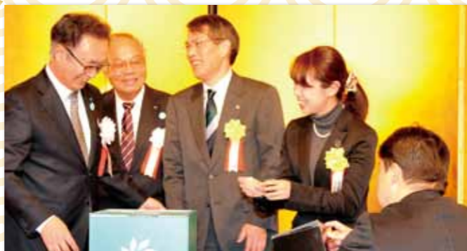
おたのしみ抽選会