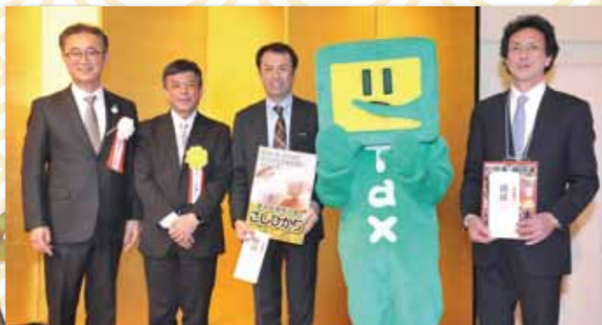
抽選会で賞品を贈呈