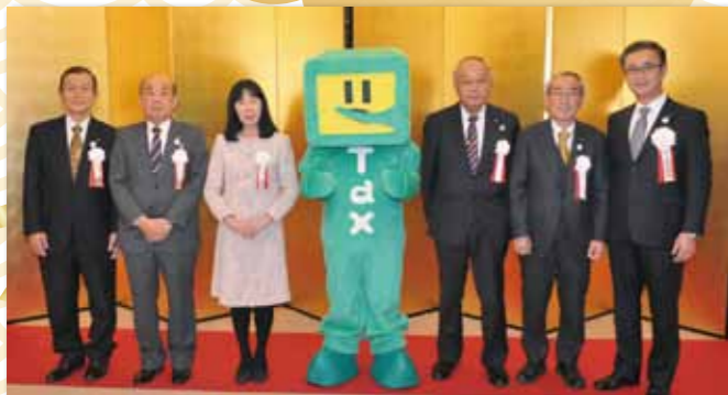
来賓、会員をお迎える当法人会の正・副会長とイータ君