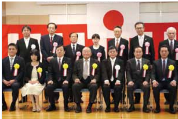
練馬西税務署長感謝状受彰者