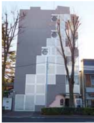
お客様の繁栄に永く貢献

弊法人は、お客様を家族と思い執事的な立場に立って、面倒見の良い仕事をすることを社是に掲げています。半世紀近い歴史から、創業者だけではなく、二代目・三代目と長きに渡りお付き合いをさせて頂いているお客様も増えました。そのため、お客様を家族同様に想い、永く家業の繁栄に貢献することに喜びや遣り甲斐を感じていることを表現した