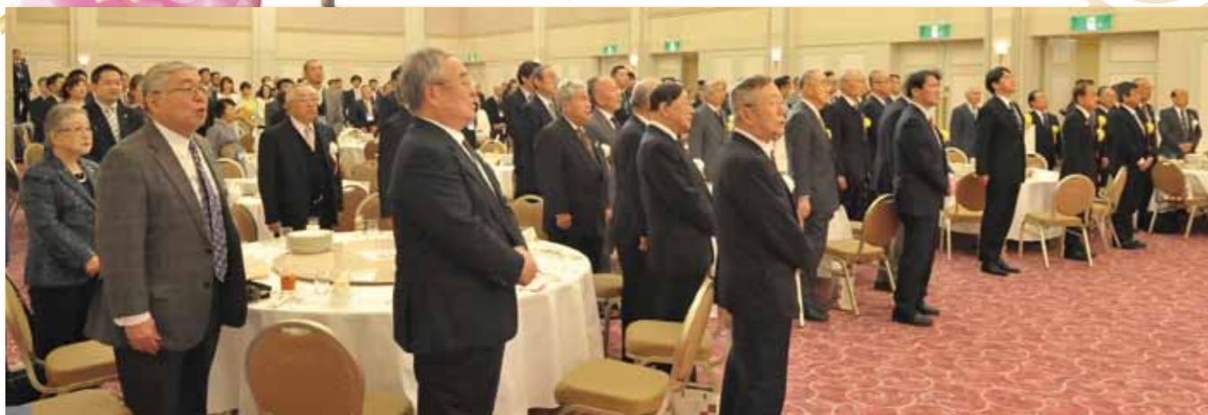
多くの皆様にお集まりいただきました。