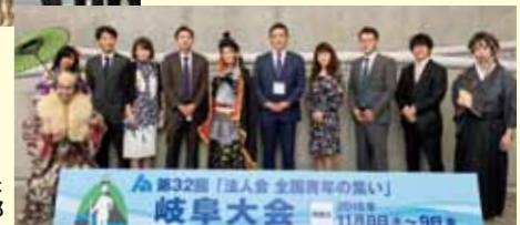
全国大会に参加した練馬西法人会青年部