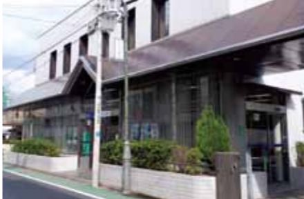
お客様に頼られる銀行を目指して

当行の経営理念である「首都圏における中小企業と個人のお客さまのための金融グループ」として、総合金融サービスを通じて、地域社会の発展に貢献します。」を胸に、「お客さまとの『対話』を重視しています。『対話』を通じて、お客さまの理解を深めて課題を共有し、課題解決に向けた提案を行い、信頼を得てファーストコール