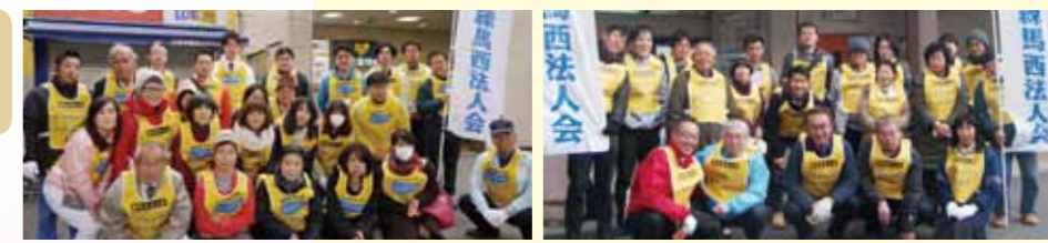
駅前清掃に参加した99名の皆さん

日時 30年12月8日(土) 場所 大泉学園・武蔵関・石神井公園・上石神井の4駅前