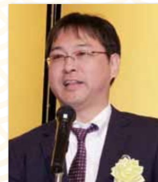
柄川練馬西税務署副署長