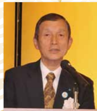
本橋副会長 開会の挨拶