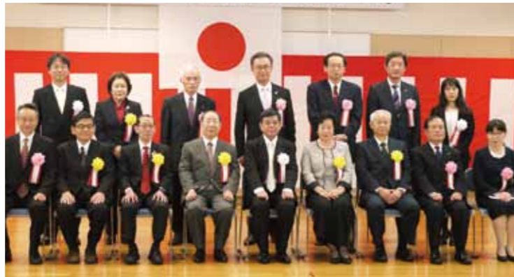
練馬西税務署長表彰受彰者