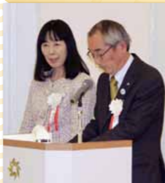
司会の森副会長(右) 丸山副会長(左)