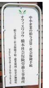
助成金のお手伝い

本年四月より本格的に始動する「働き方改革」でも、助成金の活用で「勤務間インターバル制度」導入などの労務整備ができます。是非、当事務所へご相談下さい。