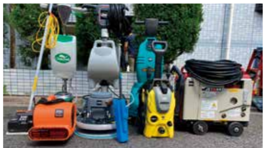
業務で活躍する機材

その反面、手が荒れる…。そのような洗剤を使用したところで、残留しないだろうか？残留することないよう、より丁寧に作業しているが、懸念していました。 そんな矢先に出会ったのは「強アルカリイオン電解水」これは抜群の洗浄力と除菌、二度拭き不要という夢のような液体です。 これを使用するようになってから、作業員の手も荒れず、通常の強力な洗剤よりもアルカリイオン電解水を使用した方がよりきれいに仕上げられます。 このアルカリイオン電解水は食品製造の現場でも活躍しているものです。食品衛生法で定められた食品を洗浄するための洗浄剤基準をクリアしていて、皮膚と接触すると中和される人体に安全なものとして活用できるというものです。 アルカリイオン電解水を活用する利点 ①アルカリは汚れを分解する過程で自ら水に戻るため残留性がない ②残留洗剤の問題もなし ③すすぎの手間が短縮されて作業効率アップ ④洗浄と同時に失活、除菌、消臭までこなす環境問題を少しでもクリアできるよう配慮していると思います。