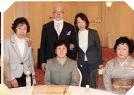
事務局長とご参列の皆さん