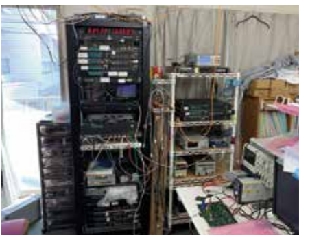
研究・開発・設計のサポート

設立されました。一般の方には馴染みの薄いインフラに近い部分を受け持つ電子機器やソフトウェアの研究開発設計を行なっております。具体的には航空機に搭載されるレーダーの信号処理装置、インターネットを使った日本標準時の配信装置、GPS(GNSS)を媒介とした遠隔校正装置などです。