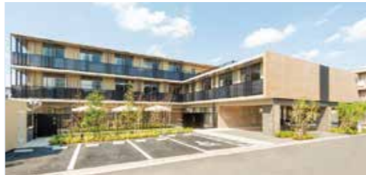
安心して健やかな暮らしを

おひとりお一人の人生に寄り添い、その方らしい生活の実現を目指して 二〇一八年十一月に開業いたしました介護付有料老人ホーム「ソナーレ石神井」は、サービスコンセプトに「Life Focus(ライフフォーカス)」を掲げ、ライフマネージャーを中心とした独自の体制で、日々その実現に取り組んでいます。 実例をご紹介しますと、あるご入居者が、住み慣れたご自宅への一時帰宅をご希望されました。そこでスタッフは、実現に向けて話し合いを重ね、事前調査でご自宅の住環境を確認したり、看護師とリハビリ