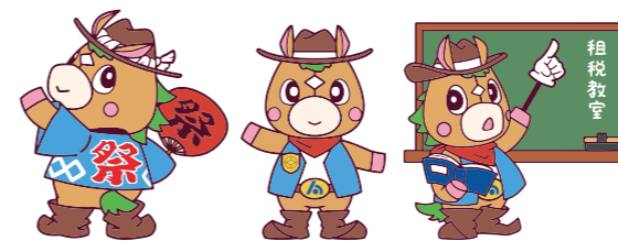
公益社団法人 練馬西法人会マスコットキャラクター「ねりりん」