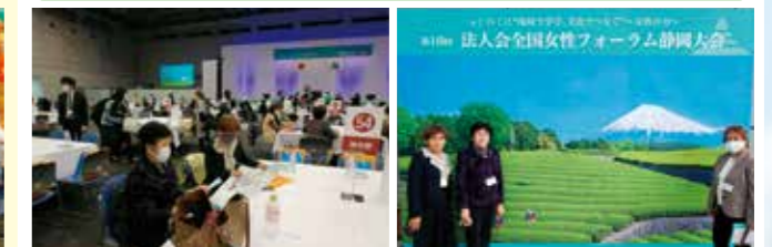
会場風景 静岡大会に参加した皆さん