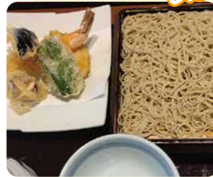
海老が絶品「天せいろ」