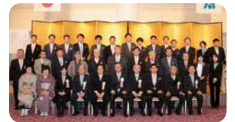
30周年実行委員とお手伝い頂いた方々