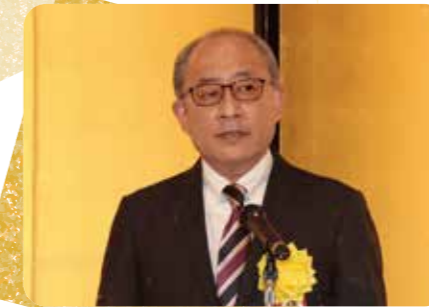
市川練馬西税務署長 祝辞