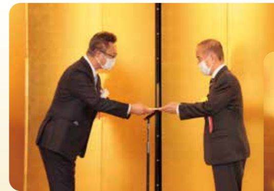
練馬区へコロナ対策寄付金を前川練馬区長へ贈呈