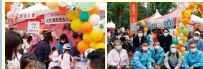
当会 ブース風景 税務署の皆様にもお越し頂きました

日時 令和4年4月24日(日) 場所 石神井公園 西側けやきひろば 人数 お手伝い26名