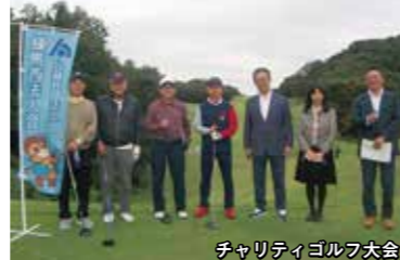
チャリティゴルフ大会