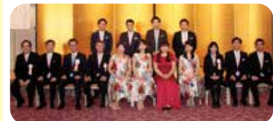
演奏いただいたフェアリーフラワーの皆さんと記念撮影