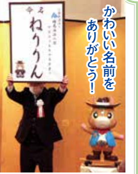
かわいい名前をありがとう！