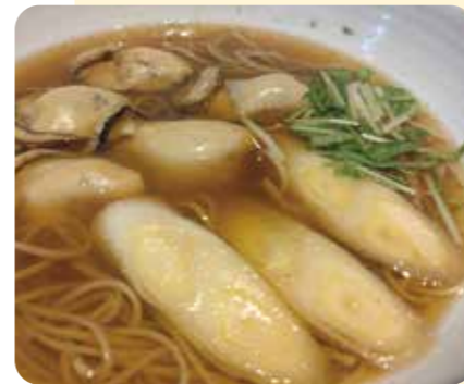
ボリューム満点牡蠣が5個入った「かき南蛮」