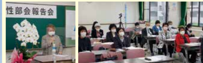
本橋部会長の挨拶 報告会の様子