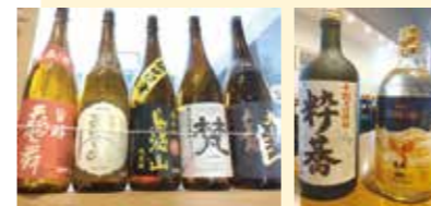
店主こだわりの日本酒