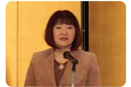
小河原練馬都税事務所長 祝辞