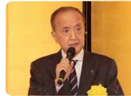
前川練馬区長 祝辞