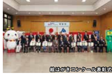
絵はがきコンクール表彰式